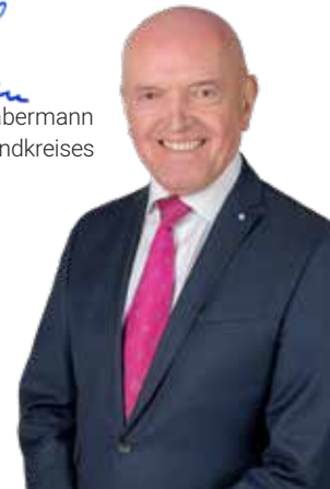
Ihr Thomas Habermann Landrat des Landkreises Rhön-Grabfeld