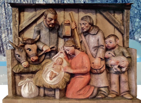
Krippenrelief: Günter Metz