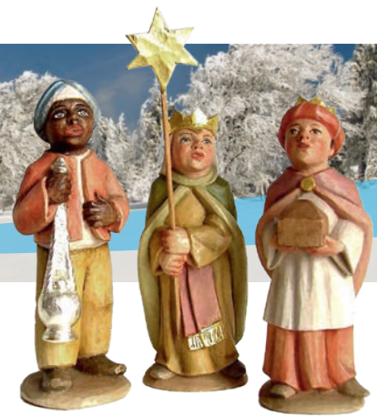
Sternsinger: Günter Metz

Ab Weihnachten können Sie die Rhöner Krippenkunst auch in zahlreichen Kirchen der Region individuell oder im Rahmen einer vorgeschlagenen Krippen-Tour (siehe S. 14 ff) bereisen.