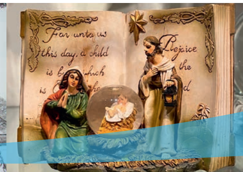
Ausstellung »Es schneit, es schneit.«