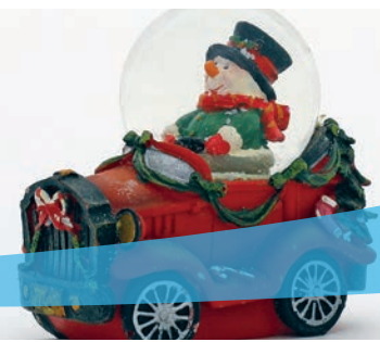
Ausstellung »Es schneit, es schneit.«