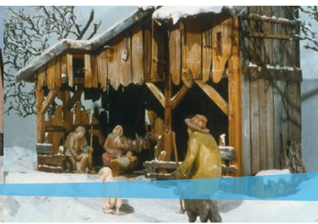
Krippe von Herbert Holzheimer