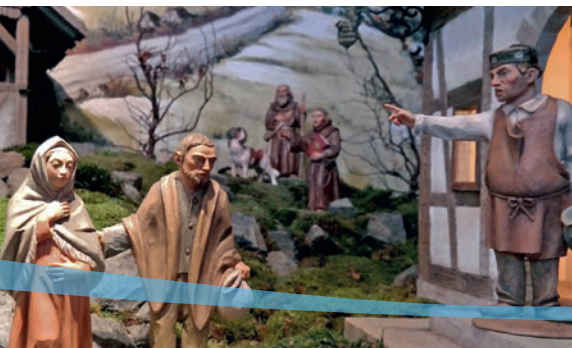
Kreuzbergkrippe von Günter Metz