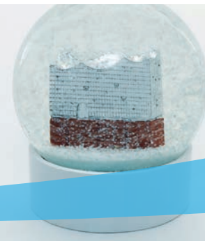
Ausstellung »Es schneit, es schneit.«