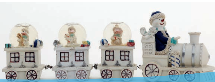
Ausstellung »Es schneit, es schneit.«